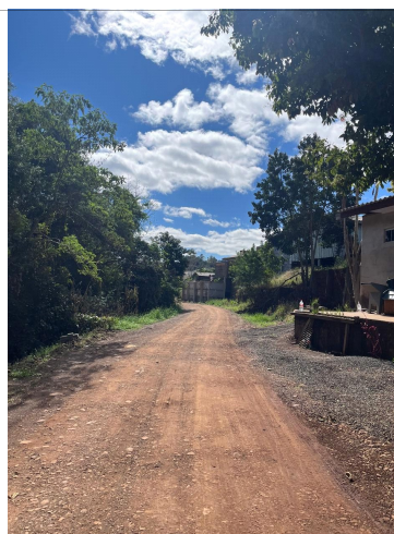
Rua Beira Rio