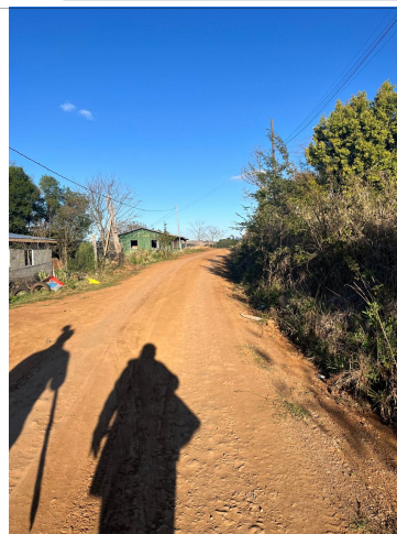
Rua José senen